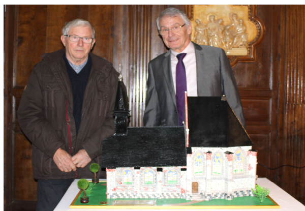
Maquette réalisée bénévolement par Monsieur ABRAHAMME de Feuquières