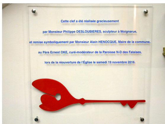
Clé symbolique installée sur la plaque rappelant la réouverture