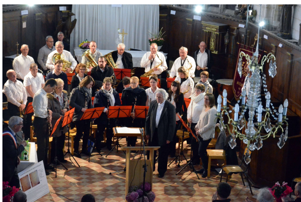
L'harmonie fidèle à toutes les manifestations