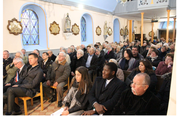
La nombreuse assistance