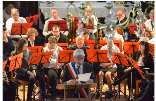
Discours de Mr le Maire