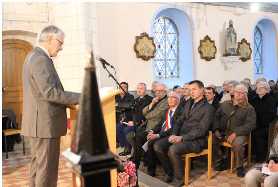
Introduction du président de l'association « grand chœur »