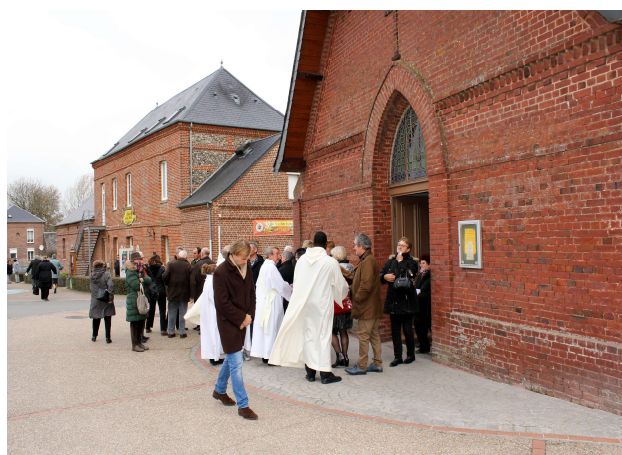
Sortie de la messe