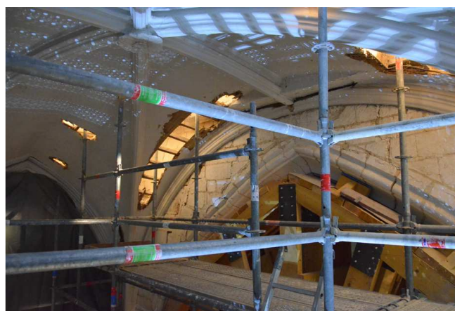
Echafaudage intérieur Perçement de la voûte du chœur

En cette fin de semaine 48, elle a même revêtu un voile blanc de protection.