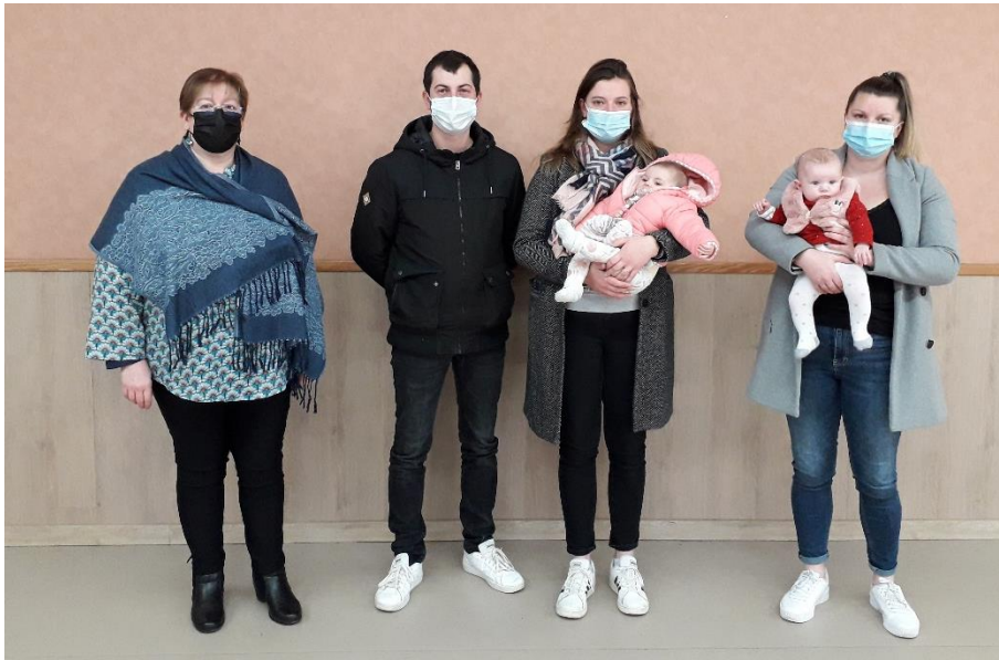
Parmi les parents présents